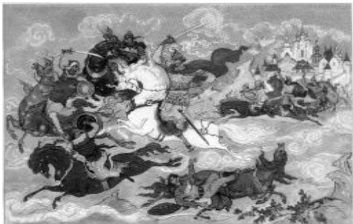
Иллюстрация к поэме «Руслан и Людмила»

В этом же году Пушкин закончил и напечатал свою первую поэму «Руслан и Людмила». Это по-