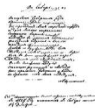
Рукопись стихотворения «В Сибирь...»

турными критиками, которые не понимали его творчества. Но он много работал, писал в основном небольшие лирические стихотворения. Его поэзия отражает более глубокое, чем раньше, познание жизни, показывает духовное, умственное развитие автора. Темы его произведений становятся разнообразнее, появляются новые идеи.