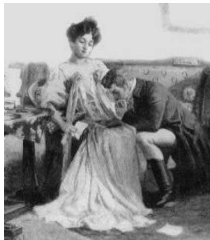
Татьяна и Евгений

Онегин путешествует по России и через три года возвращается в Петербург. Неожиданно на балу он встречает Татьяну. Она вышла замуж, стала светской дамой. За это время они оба изменились, много пережили, многое узнали. Теперь Онегин чувствует любовь к Татьяне. Он также пишет ей об этом в письме, но Татьяна не отвечает ему.