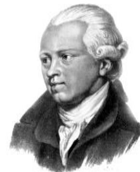
Денис Иванович ФОНВИЗИН (1744-1792)

В это же время в русской литературе в творчестве Дениса Ивановича