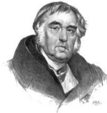
Иван Андреевич КРЫЛОВ (1769-1844)

В начале XIX (девятнадцатого) века в русской