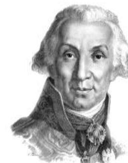
Гаврила Романович ДЕРЖАВИН (1743-1816)

Писатели классицизма в своих произведениях говорили об истории России и