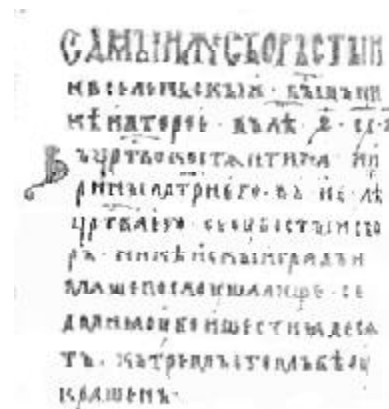
Страница книги XIII века