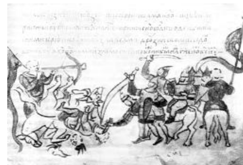
Битва князя Игоря с врагами (из летописи)

«Слово о полку Игореве» имело большое значение для развития древнерусской литературы.