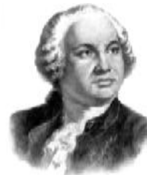
Михаил Васильевич ЛОМОНОСОВ (1711-1765)

XVIII (восемнадцатый) век - важный этап в развитии русской литературы. В это время в русской литературе появляются выдающиеся литераторы, зарождаются литературные направления. Развиваются эпос, лирика, драма. Литературный язык приближается к разговорному. Печатаются