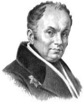
Василий Андреевич ЖУКОВСКИЙ (1783-1852)

XIX (девятнадцатый) век стал золотым веком в истории русской литературы. Русская литература получила мировое признание.