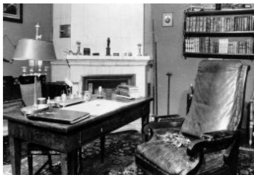
Михайловское. Кабинет А.С. Пушкина

«Борис Годунов» - это первая реалистическая трагедия в русской литературе. Название трагедии получила по имени русского царя Бори-