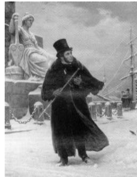
А.С. Пушкин в Петербурге

Поэт часто чувствовал грусть, одиночество. Многие его друзья-декабристы были далеко: в Сибири и на Кавказе. Он глубоко переживает за их судьбу. У Пушкина начались конфликты с новой властью. Были споры с литера-