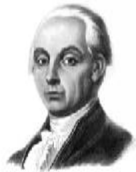
Александр Николаевич РАДИЩЕВ (1749-1802)

Фонвизина (1745 (тысяча семьсот сорок пятый) - 1792 (тысяча семьсот девяносто второй)), Александра Николаевича Радищева (1749 (тысяча семьсот сорок девятый) - 1802 (тысяча восемьсот второй)) появляется критическое изображение действительности.