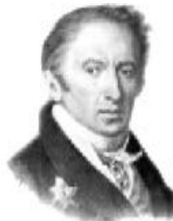
Николай Михайлович КАРАМЗИН (1766-1826)

Сентиментализм - литературное направление второй половины XVIII (восемнадцатого) - начала XIX (девятнадцатого) века. Произведения сентиментализма изображают внутренний мир человека, его чувства и желания.